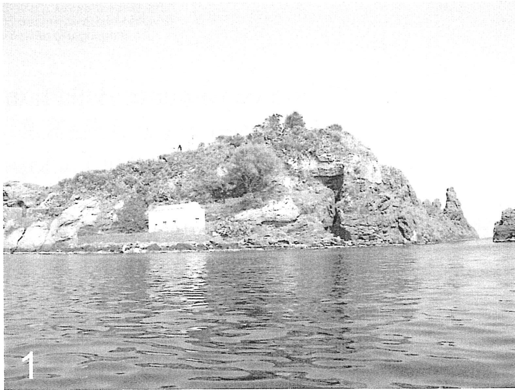
Fig. 1 – L'Isola Lachea.