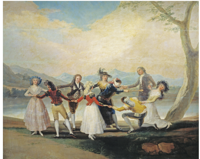
Fig. 9: La Gallina Ciega 18 .

La arrogancia y actitud despectiva de Fernando por la invitación de Paquiro a Rosario durante el baile del candil molesta a los majos y majas quienes empiezan a ver que esto puede terminar mal. Paquiro se siente especialmente herido por la actitud de Fernando y tras intercambiar improperios deciden zanjar el tema de modo trágico. En el tapiz La maja y los embozados (Fig. 10) vemos una escena campestre donde los hombres embozados tapan su cara para no ser reconocidos y buscan bronca o realizar alguna fechoría. En este lienzo podemos imaginar a Paquiro y Fernando que acuerdan batirse en un duelo, dando comienzo este momento tan dramático donde los celos toman el control de la historia.