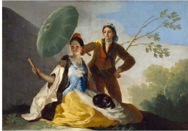
Fig. 5: El Quitasol 13 .

En esta escena, titulada Los requiebros , llega Rosario en una litera en busca de Fernando para una cita pero no lo ve y ella cree que no ha acudido al encuentro. Por este motivo se siente avergonzada y contrariada por la situación ante todo el gentío. Pero Fernando si la ha visto y observa desde la lejanía su comportamiento.