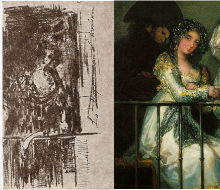
LAS MAJAS EN EL BALCÓN