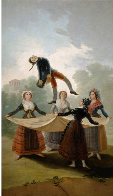
Fig. 4: El Pelele.

Aparece entonces el primer personaje, Paquiro, el famoso torero que se dirige a las majas que hay en escena mientras les regala flores y las piropea. Es en este alegre y divertido ambiente cuando se abre paso la segunda escena de la ópera titulada La calesa donde Pepa, novia de Paquiro, aparece en calesa entre el gentío el cual la aclama y corea el siguiente texto: