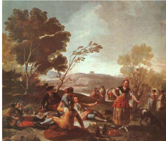
Fig. 3: Merienda a la orilla del Manzanares 11 .

La ópera comienza a orillas del río Manzanares, en San Antonio de la Florida, con un ambiente musical muy festivo donde majas y majos cobran protagonismo. El tapiz de Goya que vemos en la figura 3 da vida a esta escena popular de majas y majos.