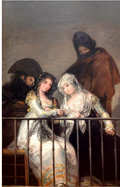
Fig. 11: Las majas en el balcón 21 .

Seguidamente Rosario entra lentamente en su residencia y reaparece en una ventana con rejas. Fernando llega y ambos comienzan una intensa conversación amorosa a través de las rejas de la ventana que da lugar a la escena Dúo de amor en la reja (corresponde a Coloquio en la reja en la suite pianística), donde se refleja el amor y el conflicto entre ambos. Granados realizó un dibujo de esta misma escena titulada como la propia pieza en la obra para piano. El texto de la escena refleja un amplio espectro de emociones, desde la ternura y la tristeza al dramatismo, pasando por las quejas y la súplica. Granados para ello usa continuos cambios de tiempo, texturas y dinámicas. Además a lo largo de la pieza se puede apreciar el efecto de una guitarra, tan presente siempre en la música española, tal y como Granados anotó en la partitura “todos los bajos imitando la guitarra”.