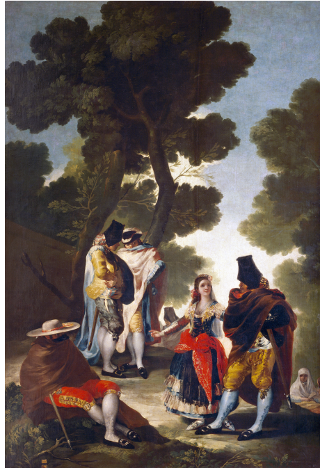
Fig. 10: La maja y los embozados 19 .