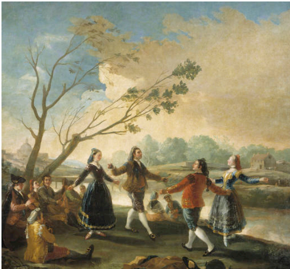
Fig. 8: Baile a orillas del Manzanares 17 .

El segundo cuadro se desarrolla durante la noche bajo la luz de una vela y es cuando tiene lugar la escena popular de El baile del candil (correspondiente a El fandango del candil en la suite pianística). Se trata de una danza llamada fandango donde una pareja baila en ritmo ternario y acompañada de guitarra y castañuelas o palmas. En los siguientes cartones para tapices de Goya podemos ver algunas pinturas donde se representa la temática del baile popular. Por un lado Baile a orillas del Manzanares (Fig. 8) y por otra La gallina ciega (Fig. 9).