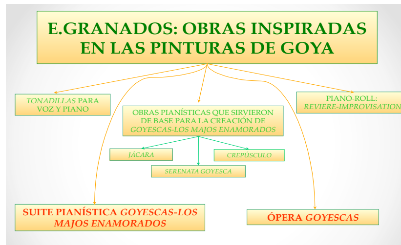
Fig. 1: Obras escénicas, vocales y pianísticas de Granados inspiradas en la pintura de Goya.

En la figura 1 podemos observar un gráfico en el que se muestra un gran número de obras escénicas, vocales y pianísticas compuestas por el compositor catalán e inspiradas en la pintura de Goya. A todo este conjunto de obras se les llama Goyescas, siendo la suite pianística Goyescas - los majos enamorados donde el compositor catalán alcanza el punto culminante en su carrera compositiva.