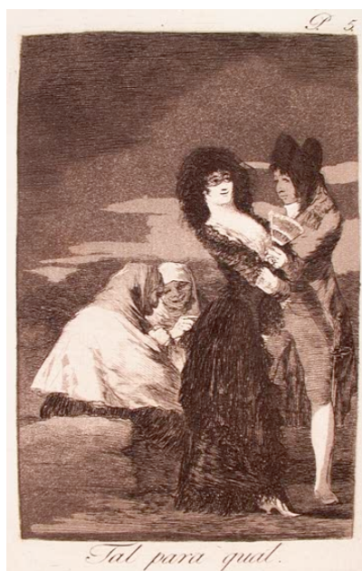
Fig. 7: Tal para cual.

El capricho Tal para cual (Fig. 7) también inspira a Granados para crear este momento musical de Los requiebros . Según Periquet (1916) 16 , podemos observar al personaje de la ópera, Fernando, el capitán de la guardia real en este grabado. A su lado, una maja vestida de negro con una mantilla y dos ancianas sentadas al fondo.