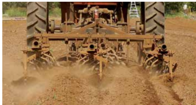
FIGURA 1. Cultivadora de "arañas" rotativas.

* Nota: Puede ser necesario meter la cultivadora de "arañas" rotativas para romper terrones antes de formar las camas. La humedad de la lluvia o el riego por aspersión facilitará esta operación. Una vez que los terrones se reducen, se pueden formar camas con el cultivador rotativo.