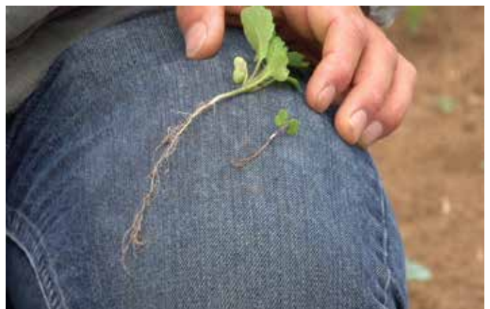
FIGURA 4. Elimine las malezas en su etapa pre-emergente (etapa de hilo blanco) y en cuanto las malezas aparezcan.

Al plantar en humedad, la capa de suelo encima de la cama debe ser despejada mecánicamente para que la sembradora pueda poner las semillas en suelo húmedo. Esta operación se hace más eficientemente con una reja de ala ancha (Alabama Shovel) montada en frente de la sembradora para que empuje el suelo seco a los lados en la superficie de la cama. Cuando se coloca correctamente, la reja debe dejar un canalillo en forma de "V" en el centro de la cama. El suelo debe contener suficiente humedad en la parte baja, para dar inicio a la germinación de la semilla recién sembrada.