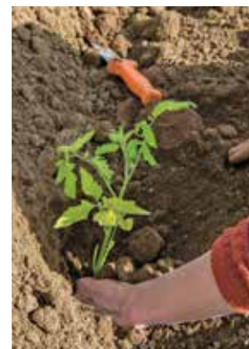
FIGURA 6. Plantación de tomate en seco.

Cuando las papas estén lo suficientemente altas (8-12"), haga una segunda escarda con un arado rotativo, con discos invertidos o rejas para volver a darle forma a la cama y asegurar que las papas estén adecuadamente cubiertas con tierra para minimizar el daño solar.