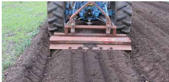
FIGURA 2. Formador de camas con guías para el trasplante.

El implemento para formar las camas es un implemento de tres puntos que se conecta al tractor y se usa para aplanar la parte superior de la cama, dejando una cama lisa, suave, y bien formada para plantar. Las sembradoras se pueden integrar directamente a la formadora de camas y así poder realizar la plantación y la formación de las camas de manera simultánea, en un solo paso. También se pueden integrar las barras o guías que marcan las líneas donde irá el trasplante (Figura 2).