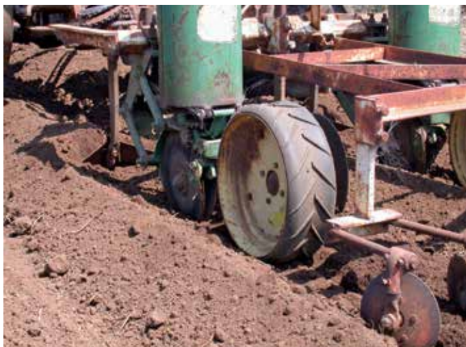
FIGURA 5. La reja de ala ancha (Alabama Shovel) quita o abre el suelo de encima de la cama y la semilla cae en suelo húmedo y es cubierta con los discos en ángulo ("soil cappers") que se encuentran detrás de la rueda grande de la sembradora.

La siembra de frijol y semillas de calabaza de invierno en la parte honda del centro de la cama conservará la humedad más profunda en el suelo porque todavía queda mucho suelo suelto por encima de la línea donde van las semillas, limitando así la pérdida de la humedad por evaporación. La siembra de cultivos de semilla grande (maíz, calabaza, melón y otros) en humedad, también reduce el riesgo de que los patógenos del suelo (como damping off complex o muerte de las plántulas) puedan tener un efecto negativo en su desarrollo. La muerte de las plántulas es más probable que ocurra cuando las semillas se plantan y después se riegan para germinarlas con riego por aspersión o por goteo.