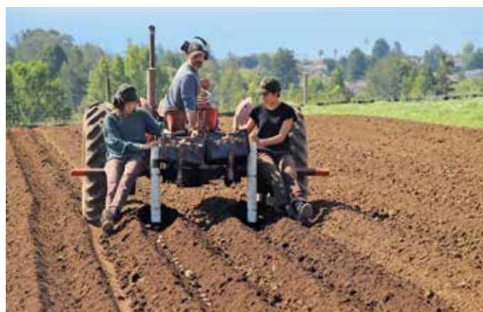
FIGURA 7. Plantación de semilla o tubérculos de papa.