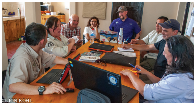
FIGURA 4. Consultas y talleres in situ con los cinco parques participantes en el proyecto JON KOHL

embargo, la larga demora por la pandemia agravó este proceso porque no solo hubo un cambio de personal en los parques y de los equipos de trabajo de este proyecto, sino también un cambio de funcionarios del gobierno, e incluso de la Embajada, lo que requirió realizar múltiples ajustes con los equipos de trabajo. Afortunadamente, el personal en puestos clave en APN, la Embajada, GWS y el SST se mantuvieron lo que permitió que la comunicación continuara durante la pausa y hasta su conclusión.