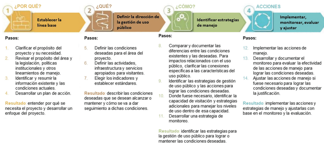
FIGURA 1. Elementos y pasos del Modelo Interinstitucional de Manejo de Visitantes de los EE. UU.

El proyecto internacional para el desarrollo de capacidades para la gestión del uso público, “Programa Binacional de Intercambio para Mejorar la Experiencia del Visitante en los Parques Nacionales”, comenzó en 2020 como un proyecto de dos años, pero debido a la pandemia, se extendió hasta 2024. El proyecto convocó a un equipo