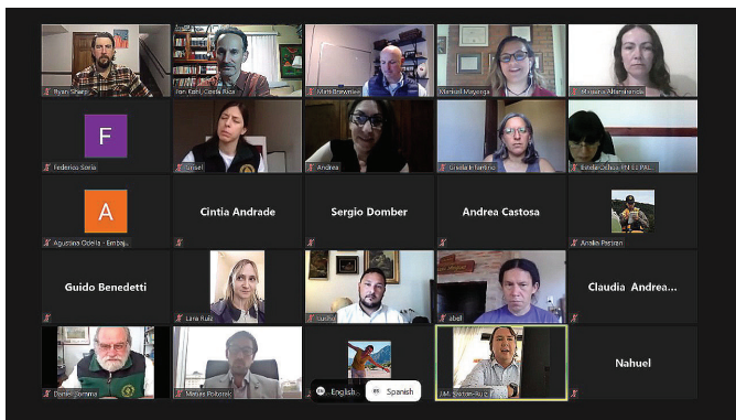
FIGURA 3. Durante los primeros tres años del proyecto se realizaron seminarios web (webinarios), reuniones y consultas virtuales con el personal y los funcionarios del parque.

por medio del manejo adaptativo y acciones de manejo asociadas”. Para la tarea, se pidió a los participantes que identificaran las condiciones existentes que se alineaban y las que no se alineaban con las condiciones deseadas.