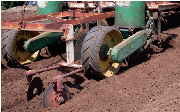
FIGURA 3. Los discos corren detrás de la rueda de la sembradora para crear una capa de suelo suelto sobre la línea de semillas.

semillas para reducir la formación de costras (si está demasiado húmedo) o para reducir la pérdida por evaporación (si está demasiado seco). Instale discos o rejas detrás de la sembradora para crear una capa de suelo suelto justo sobre la línea de semillas (Figura 3).