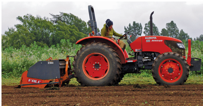
FIGURA 1. Un arado de palas (spader) se puede usar para incorporar cultivos de cobertura.

Una vez que los residuos de la cosecha o de cultivos de cobertura se descomponen adecuadamente (residuos color marrón, hojas ya deformadas) y las temperaturas del suelo están por encima de 60°F, utilice una plantadora adecuada (vea abajo) para empujar a los lados el suelo más seco y plantar las semillas en la humedad más profunda de la cama.