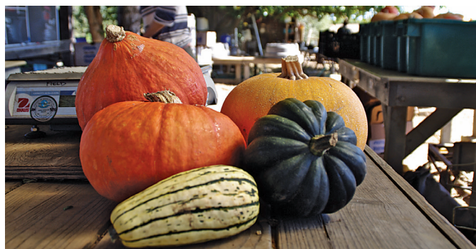
En el sentido de las agujas del reloj desde arriba a la izquierda: Red Kuri, Winter Luxury, Sweet Reba, Zeppelin, Sunshine.

Buttercup ( C. maxima ): Compacta y verde, se asemeja a un tipo kabocha, pero se distingue por una cresta redonda en la parte de la base. La pulpa es espesa, firme y algo seca. VARIEDADES: Burgess, Bush (son plantas compactas, buenas para huertos pequeños).