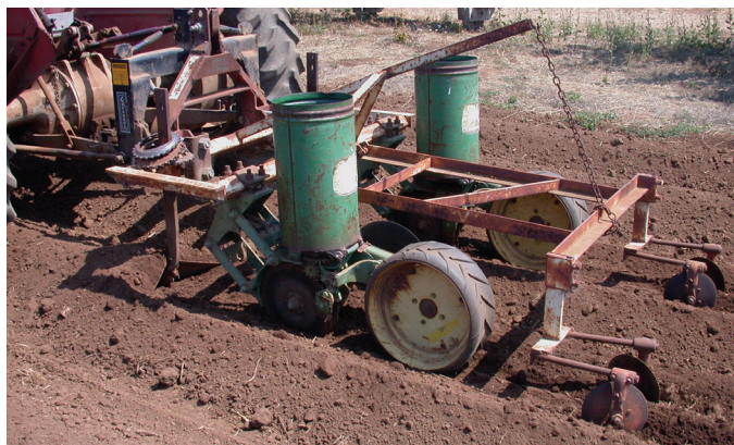
FIGURA 2. Sembradora “flexi” John Deere 71.