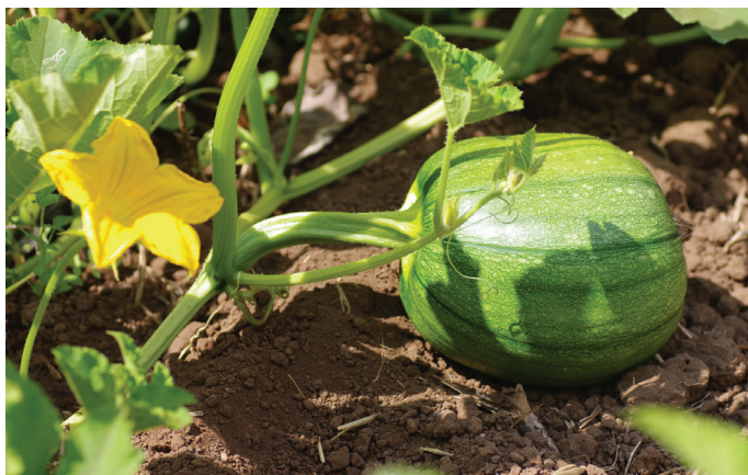
FIGURA 6. El follaje de la calabaza sombrea las malas hierbas a medida que se desarrolla el fruto.

aspersión antes de que se establezca el fruto para ayudar a controlar la enfermedad del mildiú polvoroso.