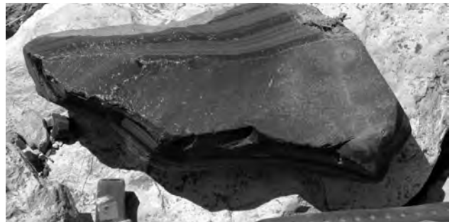
Figura 5: Nódulo grande de obsidiana encontrado en una de las quebradas de la pendiente este del Cerro Jichja Parco, Huancasancos, Ayacucho..