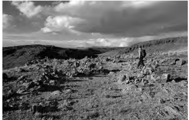
Figura 3: La cresta al frente del Cerro Jichja Parco, donde se encuentra el camino prehispánico y muchas sayhuas.