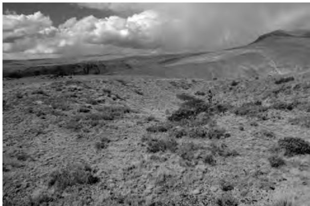
Figura 6: Un pozo de cantera (Nro 9055) de tamaño mediano; obsérvese el terraplen ubicado a la izquierda. Abundan nódulos pequeños desechados y lascas de la reducción primaria en el suelo.