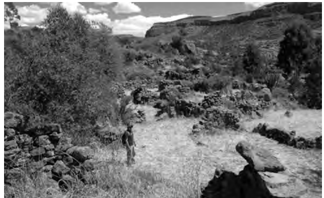
Figura 7: Rasgos arquitectónicos en el sitio del Intermedio Tardío de Marcamarca, adyacente al pueblo de Colcabamba, Sacsamarca, Ayacucho. Se encuentra aquí una alta densidad de lascas de obsidiana correspondientes a todas las fases de la reducción lítica.