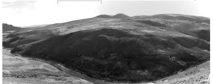
Figura 4: Cerro Jichja Parco, vista desde el lado este del Río Urabamba, Huancasancos, Ayacucho.