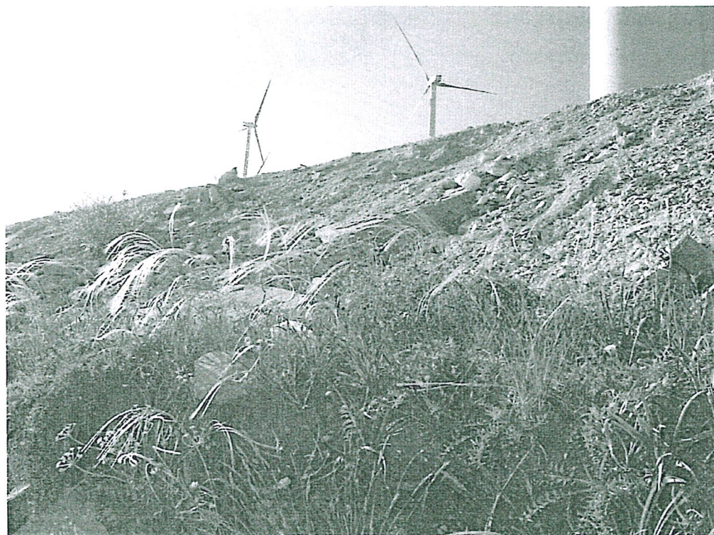
Fig. 4 - Alcune subpopolazioni della Sicilia sono minacciate, in quanto l'habitat è spesso interessato da interventi vari (collocazione di impianti eolici, realizzazione di sterrati, ecc.).