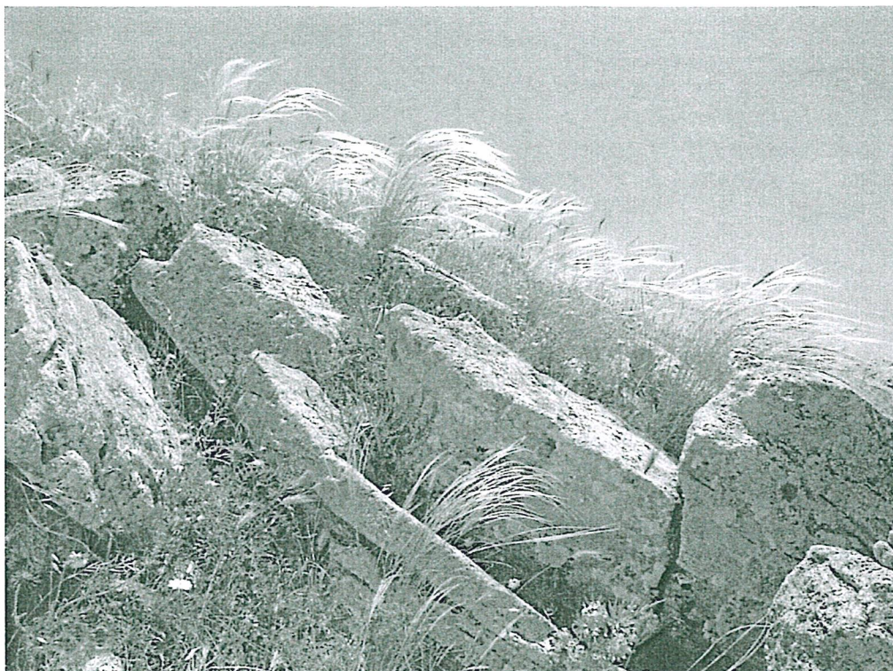
Fig. 3 - Le stazioni primarie di Stipa austroitalica ssp. appendiculata si localizzano lungo le creste rocciose, nella parte maggiormente battuta dai venti.