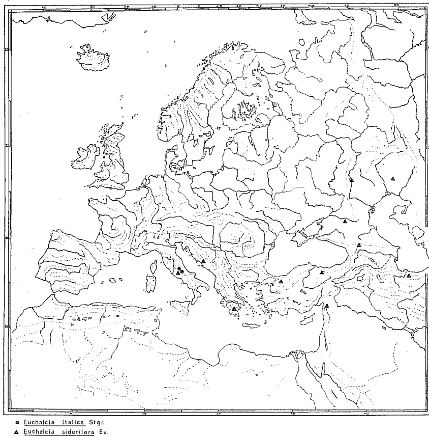
FIG. 1 - Geonomia di Euchalcia italica Stgr. e di E. siderifera Ev. (Noctuidae).

zione. Tutte le specie di Zygaena di cui è noto il cariogramma hanno n = 30 (ROBINSON, 1971) e nel caso in parola le specie parentali sarebbero le due più strettamente affini e cioè la Z. erythrus Hb., la cui geonomia si estende dalle Alpi occidentali alla penisola italiana ed alla Si-