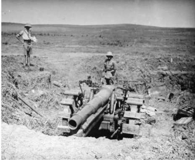
תותח גרמני שנפל שלל בידי הבריטים בסביבות טבסור (חרבת עזון, רעננה). תותח דומה הופעל בטירה ונפל שלל אף הוא

נערך קרב קשה בכיכר הכפר, בין אחד החיילים התורכים לכוחות הבריטים, עד שנפל הלל והבריטים כבשו את הכפר. הבריטים תפסו את התותח הגרמני בשלמו-תו. 83 תותח דומה נתפס בקרבת הכפר טבסור ותמונתו שמורה באוספי ה-Imperial War Museum שבלונדון. 84