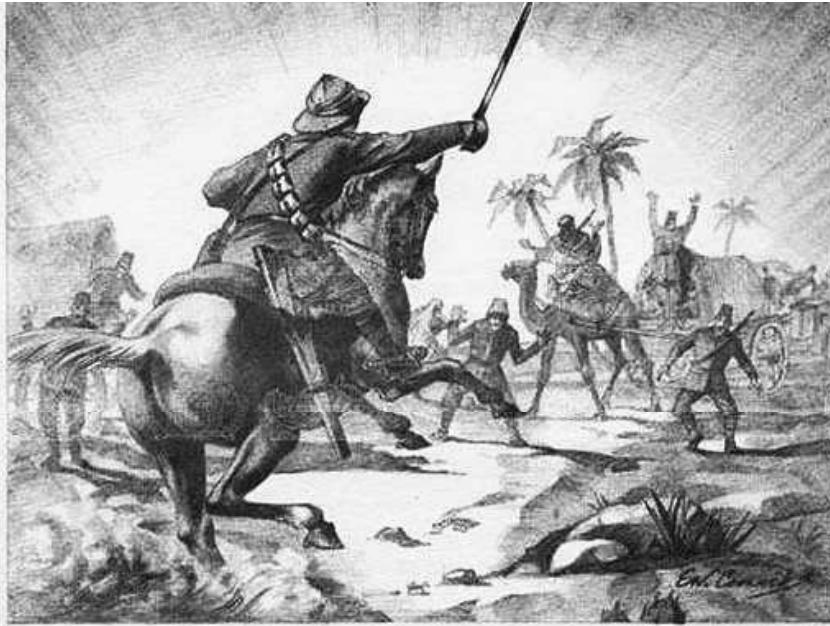
טוראי אדוארד ג'ורג' פירסט מתקיף טור אספקה תורכי ליד הפאליק ב-19 בספטמבר 1918. פורסט עוטר על גבורתו בקרב זה; DMC 18

היישוב היהודי החוזר לארצו, מקורות אלו אינם ספרי היסטוריה. "הספר על-כפר סבא, בנוי רובו ככולו על מכתבים וסיפורים של המשתתפים במאבק על הקמת המושבה שנחרבה פעמים אחדות והוקמה ושוקמה מחדש. אין זה מחקר היסטורי, אלא כאמור סיפורי משתתפים שבהם שזורים תיאורים של האירועים הגדולים מזווית ראייתו של המספר". 19 בפתח ספר 'ההגנה' של רעננה הסמוכה נכתב (1982) "ספר 'ההגנה' אינו ספר קריאה בלבד. זה ספר שיש לו גם ייעוד מונומנטלי, מעין מצבת-זיכרון לרבים וטובים ... סיפורו של היישוב עצמו, סיפור חייו ומאבקו של עם ...". 20 העורכים הציגו את התלבטותם תחת הכותרת "האנשים שעשו היסטוריה":