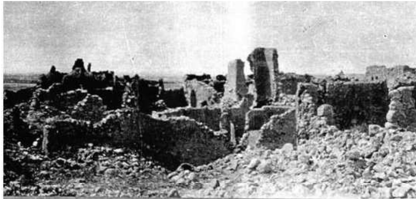
כפר-סבא הערבית בהריסותיה (ספטמבר 1918)

תיים יותר יזהם אף מנעו מהתורכים לשדוד ולבזוז. 55 דוגמה אחרת למעורבותם הייתה הסדרת גישה לתושבי כפר-סבא לבאר המים שהוחרמה לצורכי הצבא. 56 לאחר הכיבוש הבריטי, הם אפשרו לתושבים לשקם את הבאר.