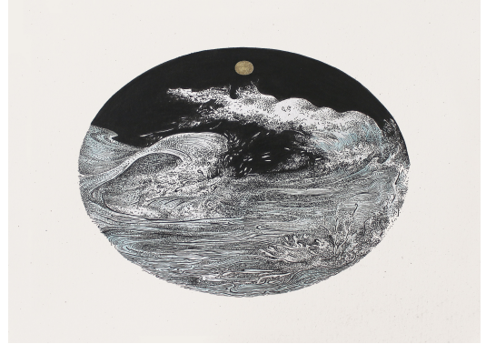
Ilustración de Allen Ladd.

Quilla mama significa madre luna, dentro de la cosmovisión andina, es quien provee el agua a través de la lluvia. Refleja a su vez, la esencia de la mujer, el don de dar vida y crear alimento de su propio cuerpo. Texto recopilado del libro Literatura Quechua, traducido por Edmundo Bendezú, 1978.