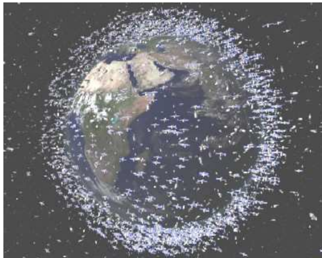
Fig. 1. "Space Debris," European Space Agency (ESA) .