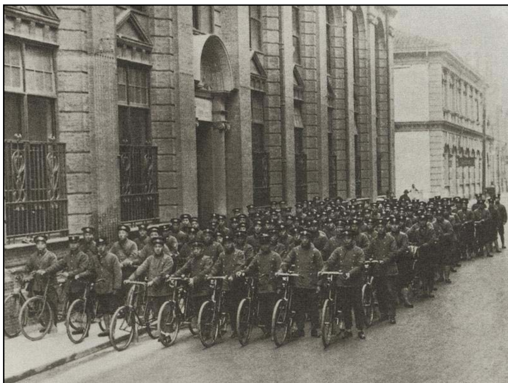
图5:1920年,上海公共租界四川路上的邮差自行车队伍。

中国其他城市随后效仿上海,公用自行车数量不断攀升。20世纪20、30年代,几乎所有中国城市的邮政局、电报局、电话公司、公用局、警察局等机关为执行公务,提高办事效率都为其职员配备了自行车;而私用则是普通市民作为代步所用和运输工具购买使用,这里包括各个洋行的职员、各大学堂的教师学生、各家报社的记者,等等。但无论公用、抑或私用,他们都被归类为自行车阶级,在城市的街道上与气焰嚣张的汽车阶级和靠出卖劳力过活的人力车阶级相区分。