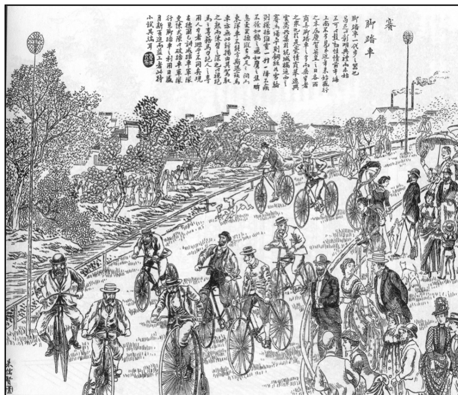
图3：《赛脚踏车》，1897年上海公共租界为庆贺英王维多利亚登基六十周年而在跑马场举办的一次自行车比赛纪实。

脚踏车，一代步之器也。曷足以彰明典礼，而未始不可以鼓动性情。前年，海上尚不多见，至近年来，始盛行之。本届庆祝英皇之日，各西商喜脚踏车之多而乘坐之者众也。于是豪情霞慕、逸兴云骞，共集于泥城桥迤西之赛马场。车则钢丝如雪，轮则机括维灵，一升一降，不疾不徐，如鹞之飞，如鹰之隼，瞬息万里，操纵在两足之间，而东洋车不能方斯迅疾，马车亦无此轻物，由其驾驭之熟，而练习之深也。以视跑马之专藉马力，跑人之专用人力者，迥乎不同矣。……行见脚踏车之利用，日盛月新百进而益上者，此特小试其端耳。 14