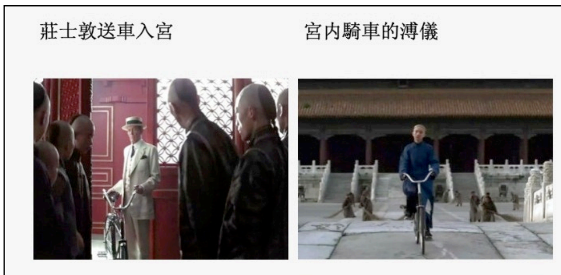
图9：电影《末代皇帝》剧照。

贝托鲁奇导演的《末代皇帝》在中国，甚至世界范围内都获得了极大的成功，1987年这部电影一举拿下了美国奥斯卡金像奖之九项大奖。庄士敦送予溥仪自行车的故事也随着电影的影响力，成为一种末代皇帝拥有第一辆自行车的最为流行的说法之一。