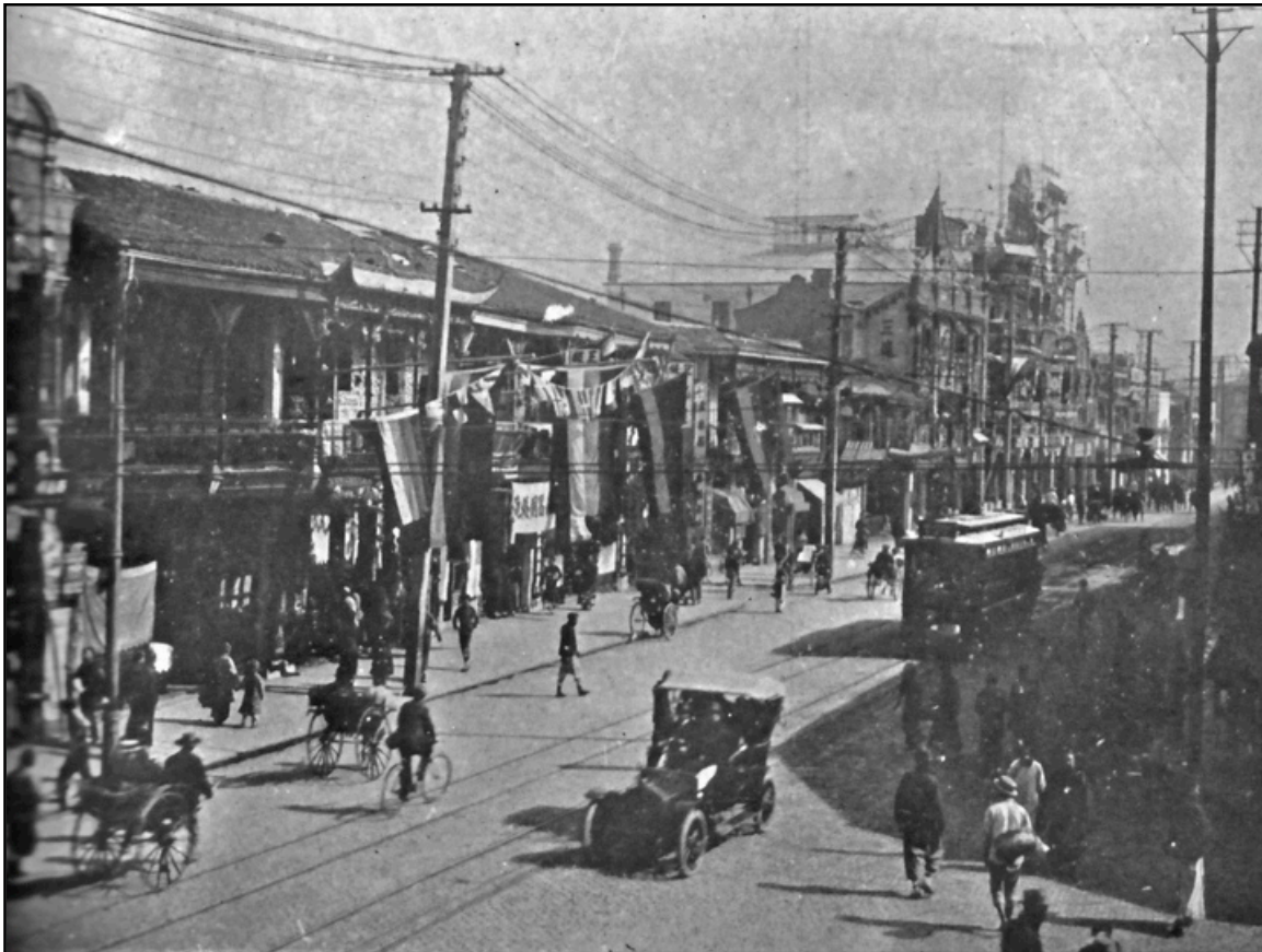
图4：1917年，上海市南京路街景，自行车、人力车、电车、汽车等多种交通工具来往穿梭于路中。

20世纪20年代，中国的各大城市的交通工具结构正在发生着翻天覆地的变化。以上海为例，1889年的6月14、15、16三日，工部局工务处主任梅恩（C. Mayne）曾在外白渡桥对上午8点到下午8点过桥的车辆人马数作过统计。兹将其数据与1926年5月17、18两日，上海公共租界工部局在同一地点对上午7时到下午7时各种车辆的数量统计数据作表格对比，可见上海城市交通工具近代化的轨迹。