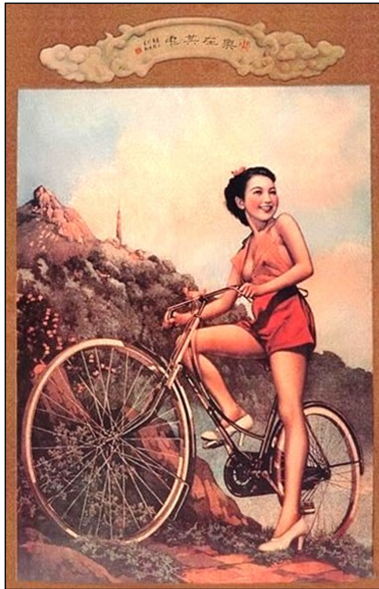
图14: 20世纪40年代，著名月份牌画家杭穉英的代表画作。