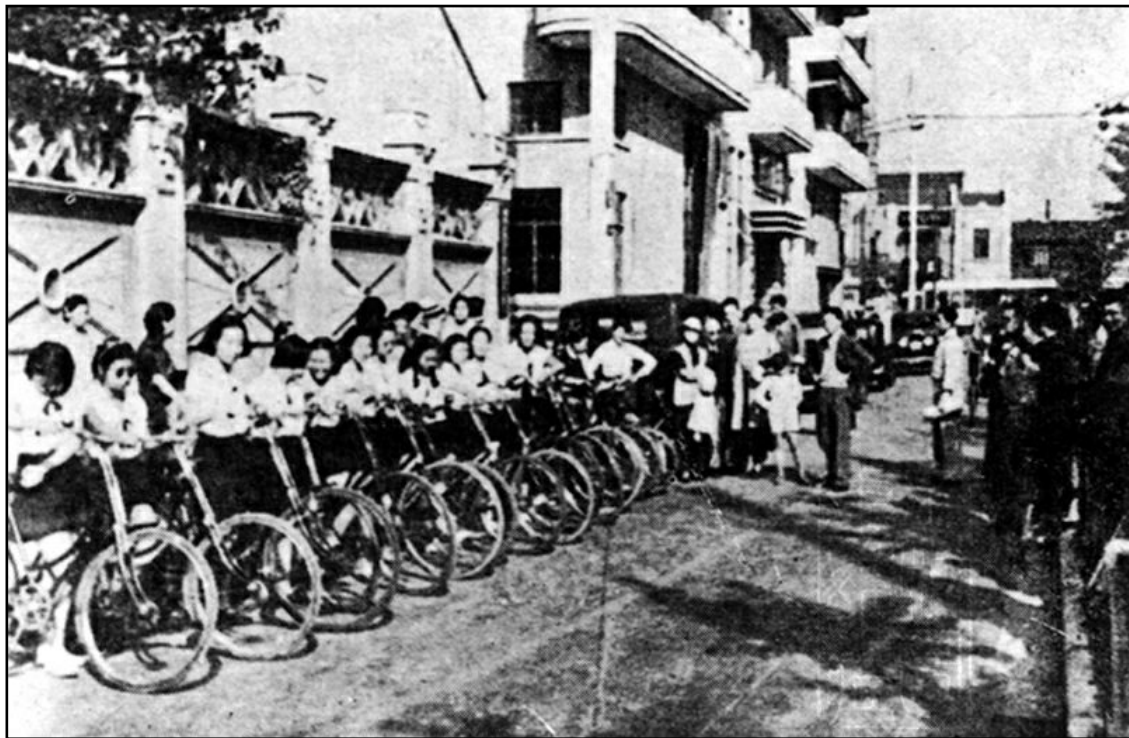
图10:1936年秋，上海车会的女学生相约骑车出游，在赫德路（今常德路）聚集出发。

19世纪后期，自行车在美国已经十分流行。作为一名卫理公会传教士，来上海传播福音之前，宋耀如在美国生活了整整八年时间（1878-1886年），对自行车想必熟知。他拥有自行车且喜欢骑车，并不令人奇怪。不仅如此，宋耀如十分注重对子女的西化教育，平常尽力保持美国化的生活方式，在他大女儿10岁时便赠与自行车，亦在情理之中。但Emily Hahn的研究依托何种资料，文中并无交待，笔者对其结论只能暂且存疑。