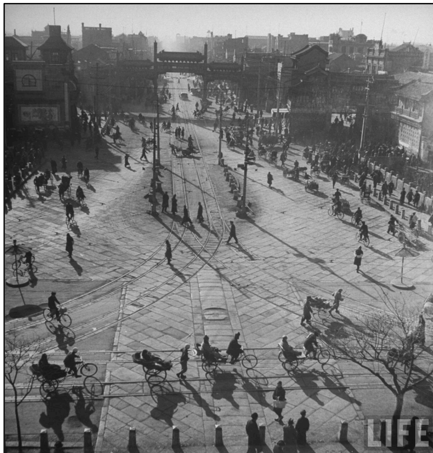
图8：1946年的北京街头随处可见自行车、改装三轮自行车等。

文中叙述，模仿摩托车的三轮自行车，是在车侧方添装船形藤筐和一个车轮，可多乘坐一人，自不必多言；而四轮自行车，为搭车人舒适而造，适于载客，大可供许多事业的汽车夫用以谋生；而三轮仿马车自行车，则最宜小家庭使用，让孩子们安坐车厢里，父母则踏车而行。至于运货可达“千把斤”的新式自行车，笔者亦未曾见过图片，不知是何物也。在其他交通工具相继敛迹的时候，自行车终究成为“平民交通的轿子”，为民众日常生活提供了诸多便利。无怪乎时人在报纸上喊出“自由车万岁！”的口号。 52