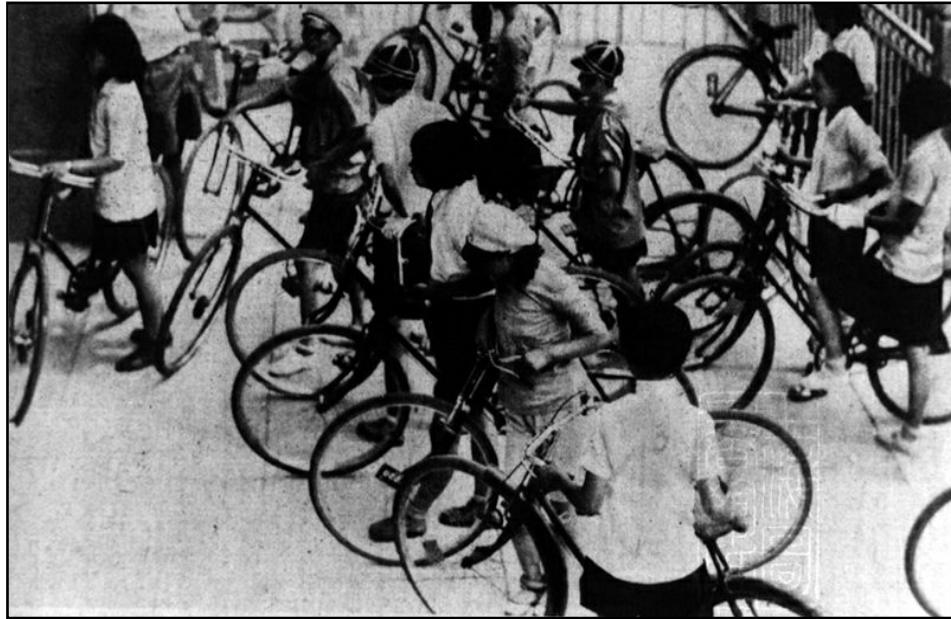
图13：20世纪40年代，遍布城市街头的女性骑车人。

这一时期，骑自行车的中国女性群体涉及的社会阶层相当广泛，其中既有为健康体魄、游娱身心而骑车的女中学生们 77 、女大学生们 78 ；也有奔波街头，为生计糊口而骑车的女报贩们 79 、女职员们 80 。