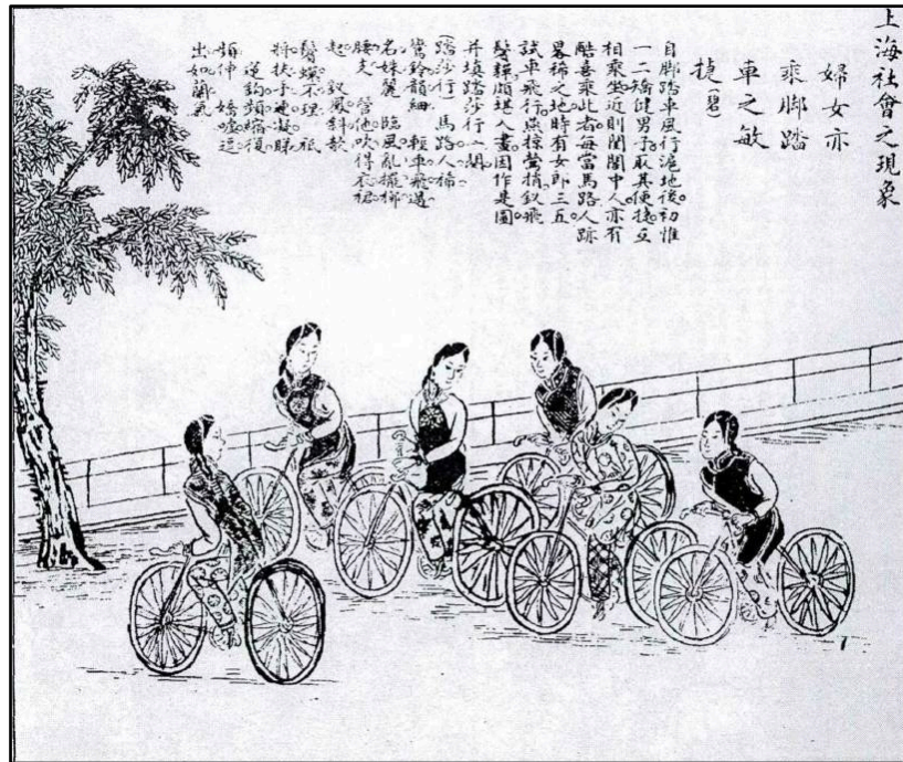
图12: 《金谷香尘走细车》。