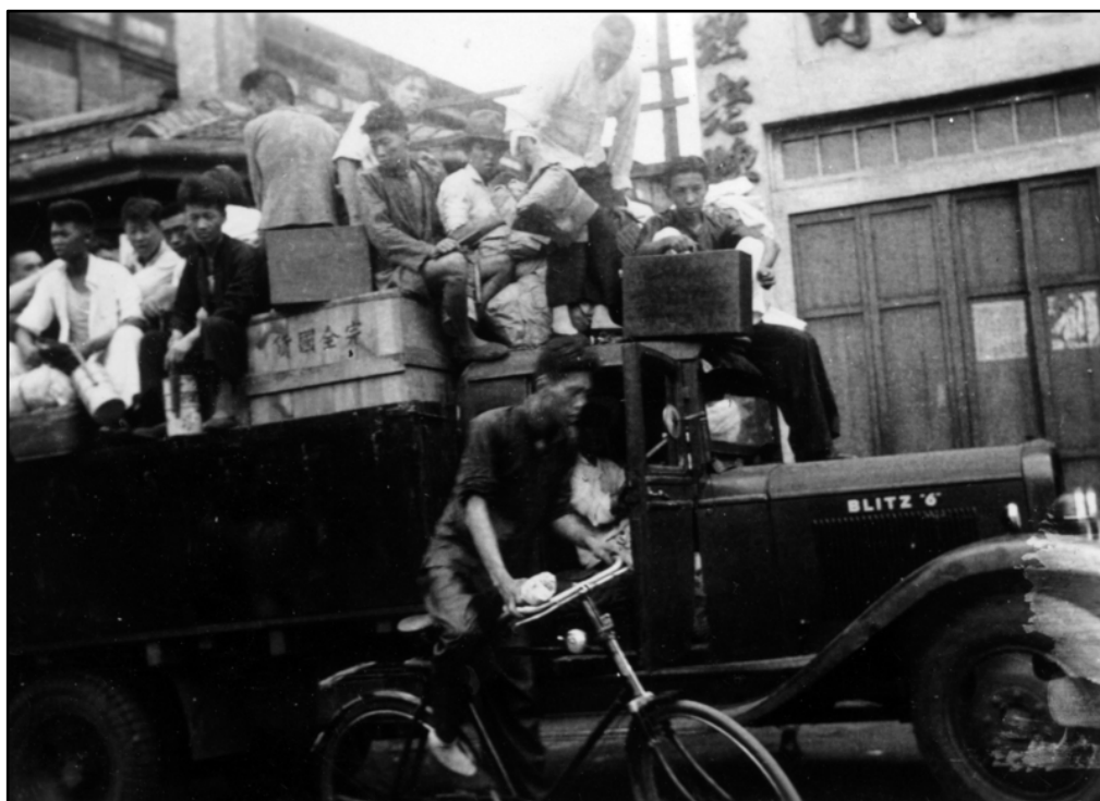
图7:1937年淞沪会战爆发时，从战场骑自行车匆匆逃往租界避难的中国难民。

汽车、摩托车的正常运行要依靠汽油，电车的正常运行要依赖电力。上海，作为近代中国最大的都市，在太平洋战争爆发之后，全城的公共交通几乎陷入瘫痪。由于汽油的缺乏，以致到了1942年1月10日上海公共汽车完全停运， 41 而电车业“亦受电流节省计划影响，而实行减少车辆，缩短时间” 42 ，不仅如此，所余营运车辆的数量，因零件损坏无法及时补给，也不断减少。到了1945年5月，上海有有轨电车128辆，但开行者不足百辆；无轨电车200辆，开行者仅30辆。 43 有人将20世纪40年代的上海马路与战争之前相比较：“畴昔乡人来沪，视马路为畏途，盖汽车飞驰，踵趾相接，偶不留神即有丧命之虞，近日则每见背负肩挑之群，行经马路中心，态度从容，若无其事，此为本埠（指上海，笔者按）情形剧变之缩影。” 44