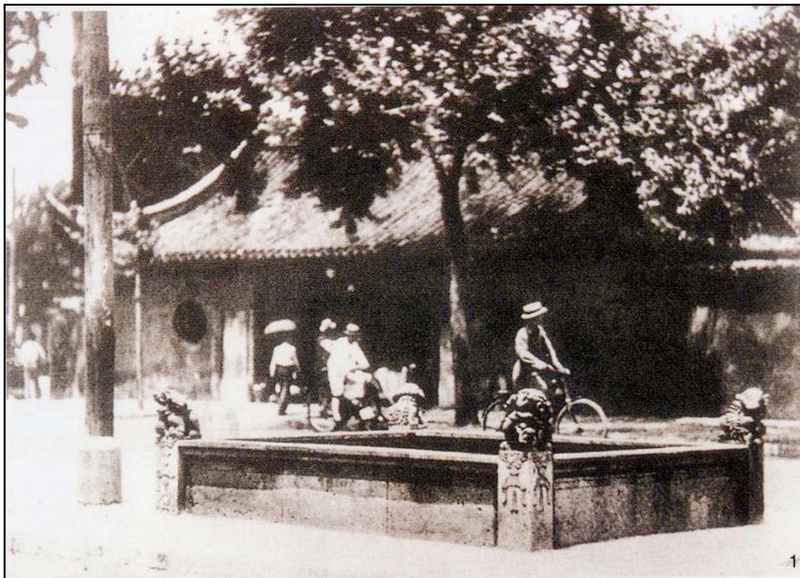
图6:20世纪20年代的中国城市中，骑自行车代步的市民已经相当普遍。

揄。” 39 萧乾对20世纪20、30年代遍布于北京城市街道中的骑车人的文学描述，轻盈鲜活地展现了那时中国城市中间阶层的夹层生存状态。