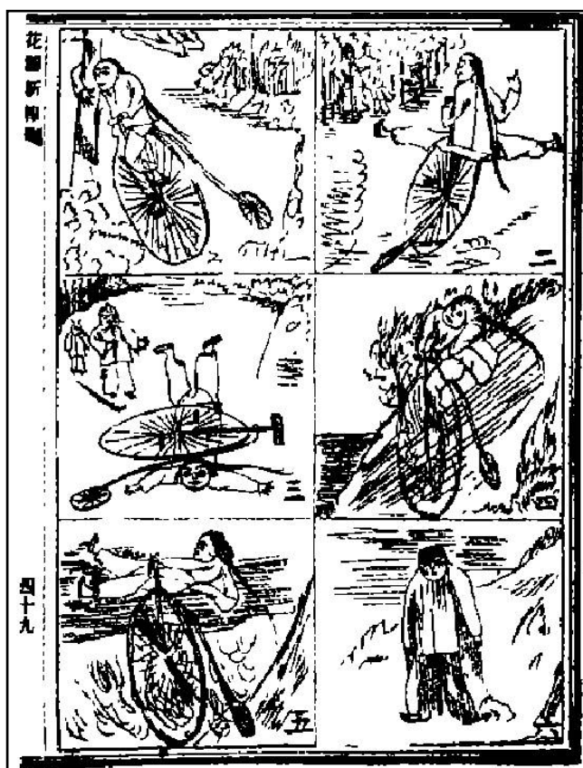
图1：《乘车落水》，讲述的是某一少年学骑自行车失败落水的故事。

自行车到我国来的时候，年代已不可考，但总在海外通商以后，……因为国人习性和习俗，不役人的就役于人，很少肯使用自己的力气，为自己服役，所以只有坐车和抬轿拉车，除了使用自己天然的两腿走路以外，自己坐车自己使力会被人笑话的，因之自行车虽传到了我国多年，还是未被扩大的利用。 10